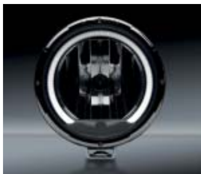
Widok w nocy