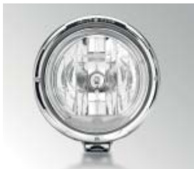
Widok w dzień