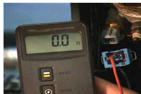
Résistance du faisceau de fils du connecteur du capteur au connecteur du calculateur