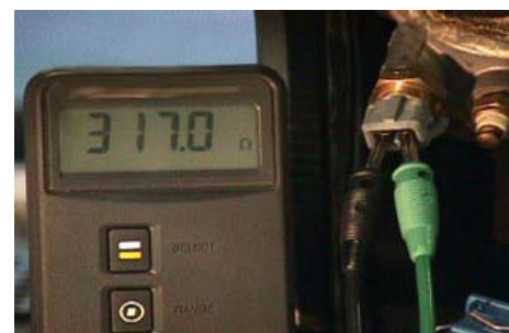
Mesure de la résistance avec moteur chaud

Respecter les valeurs de consigne spéciales.