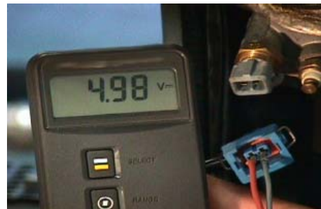
Alimentation au niveau du connecteur du capteur

Si vous n'obtenez pas de courant, vérifier d'après le schéma de branchement l'alimentation en courant du calculateur de gestion moteur. Vérifier également le fil de masse. Si l'alimentation est correcte, dans ce cas le calculateur de gestion moteur est défectueux.