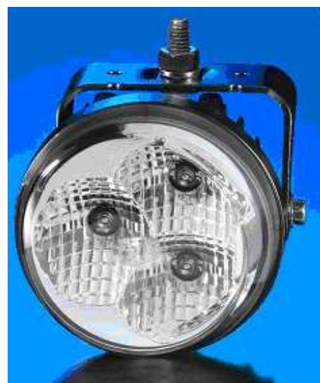
Rund Version af LED TFL

Biler, der er udstyret med vores kørelights, behøver ikke at blive godkendt hos TÜV. Der kræves heller ikke en registrering i bilens papirer. Udtræk fra dokumenterne til typegodkendelsen er vedlagt lygterne som monteringsanvisning.