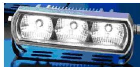
Kantet Version af LED TFL