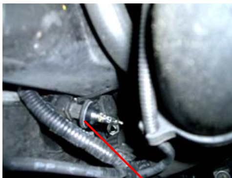
Porta-lâmpada do pisca Figura 2