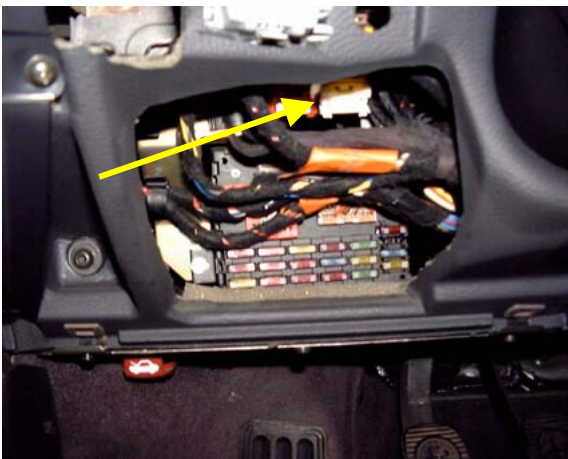
Rys. 1: Bezpiecznik ABS: pod tablicą przyrządów, z lewej strony obok kolumny kierownicy (LHD).