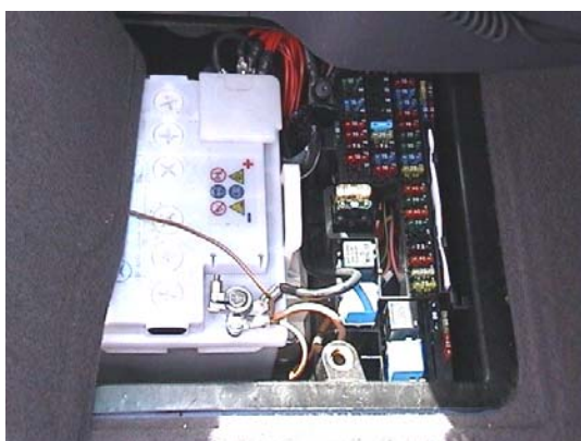
Rys. 1 Skrzynka bezpieczników