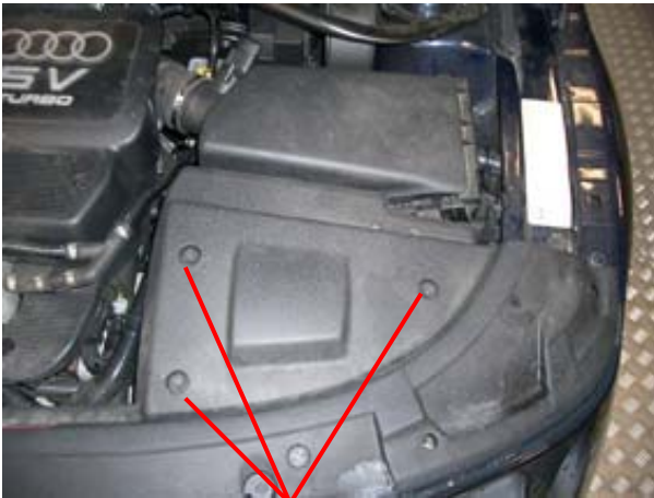
3 schroeven afbeelding 3