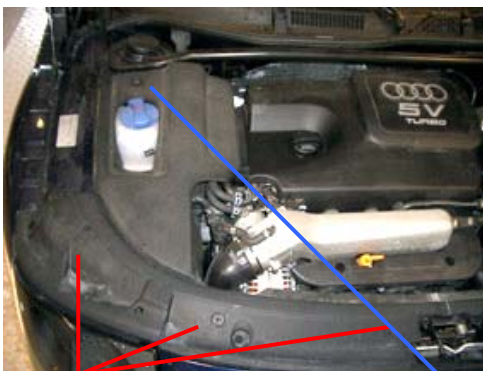
klemmen (a) schroef (b) afbeelding 1