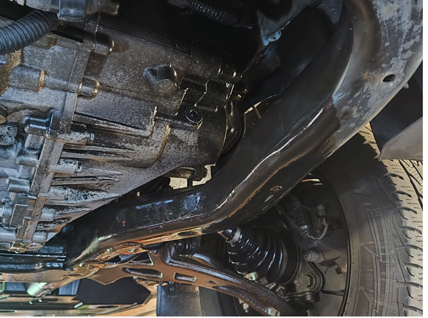
T6 yak#t kayb#