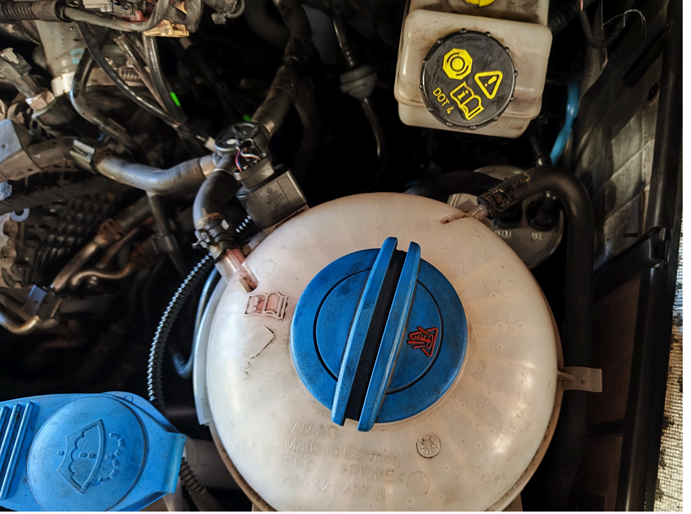
T6 genle#me haznesi