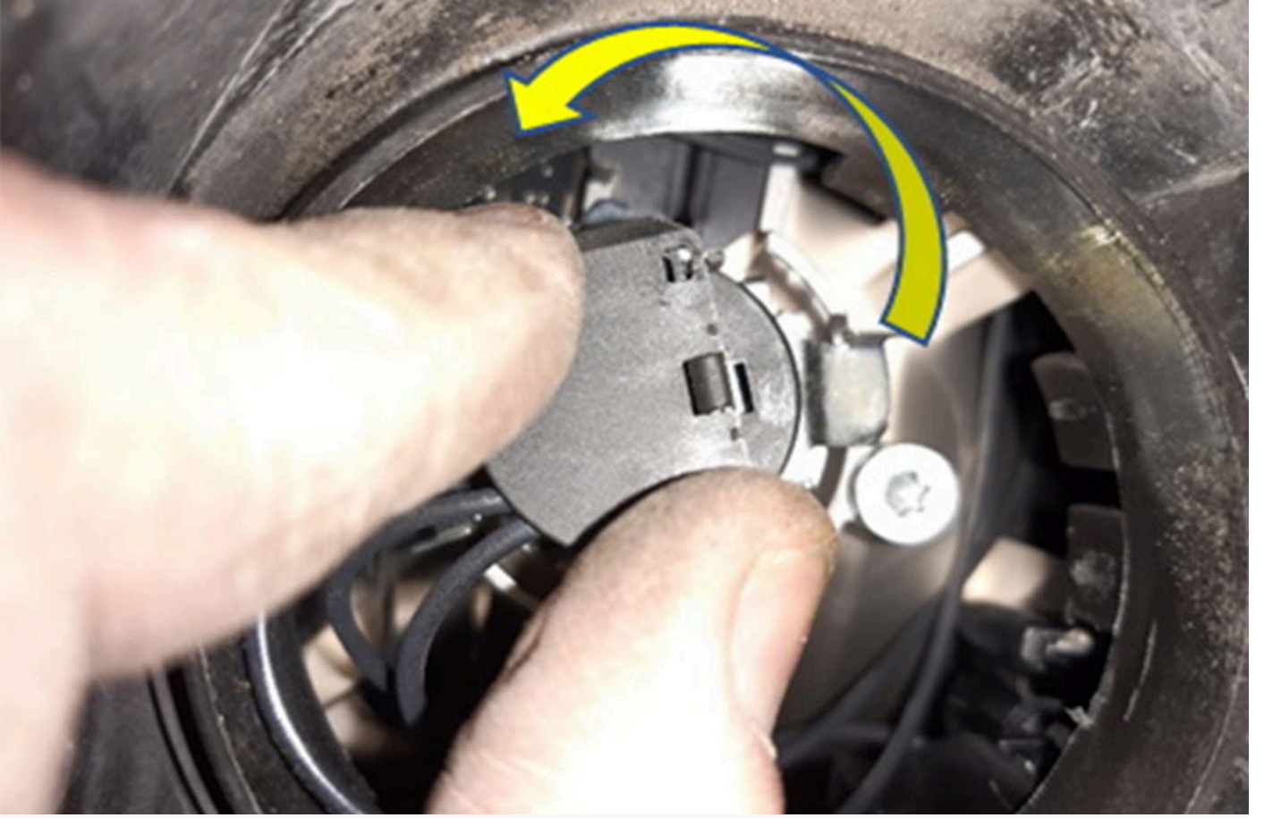
Akkor ampulün döndürülmesi