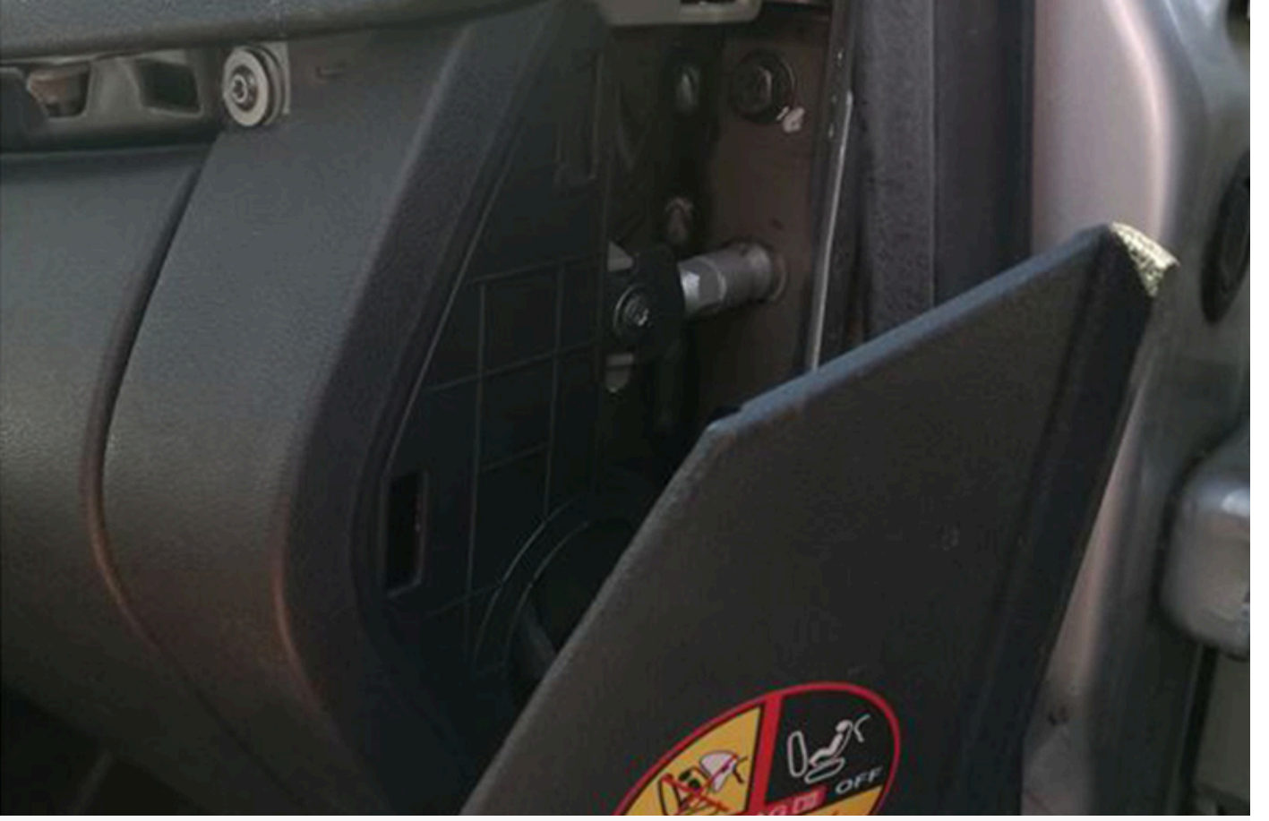
Torpedo gözünün sa##ndaki kapa## kald#r#n