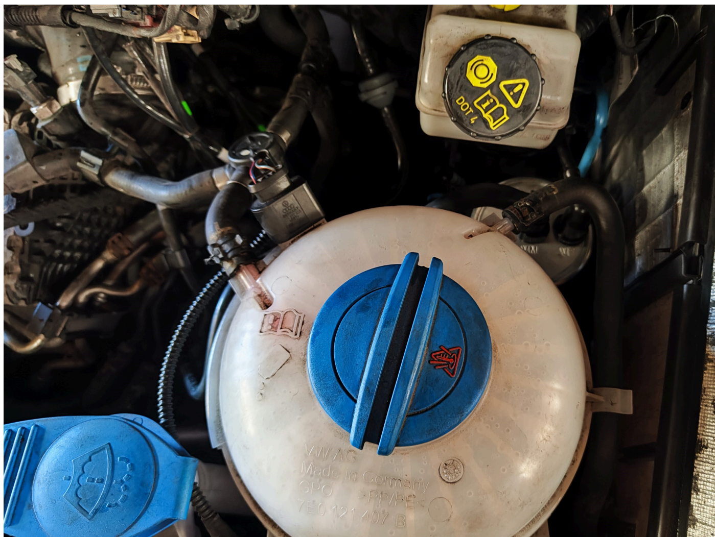
Reservatório de compensação T6