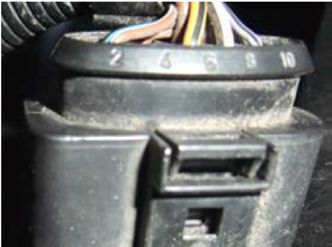
Figure 3 Figure 4