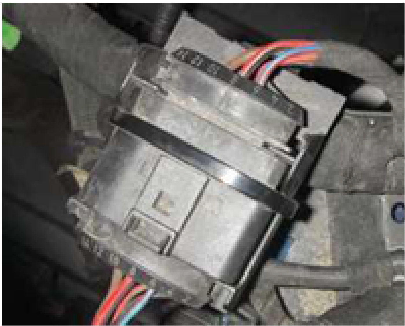
magen 2.: Enchufe 10 polos