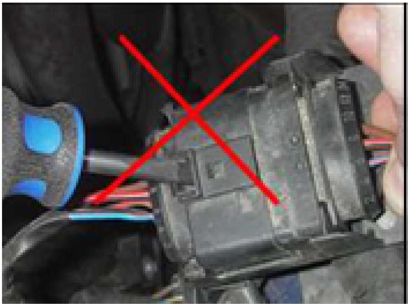
Imagen 3. Imagen 4.