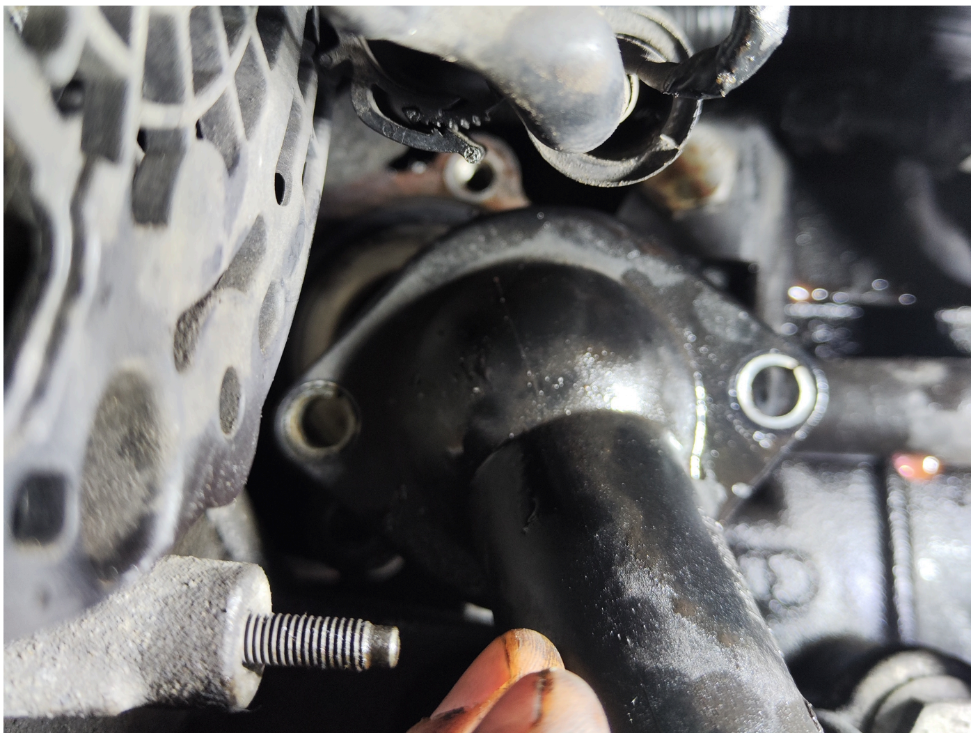
Flangia del liquido di raffreddamento T5

Si consiglia quindi di sostituire la flangia.