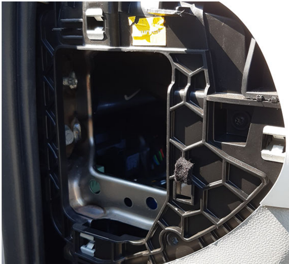
Coperchio del cruscotto