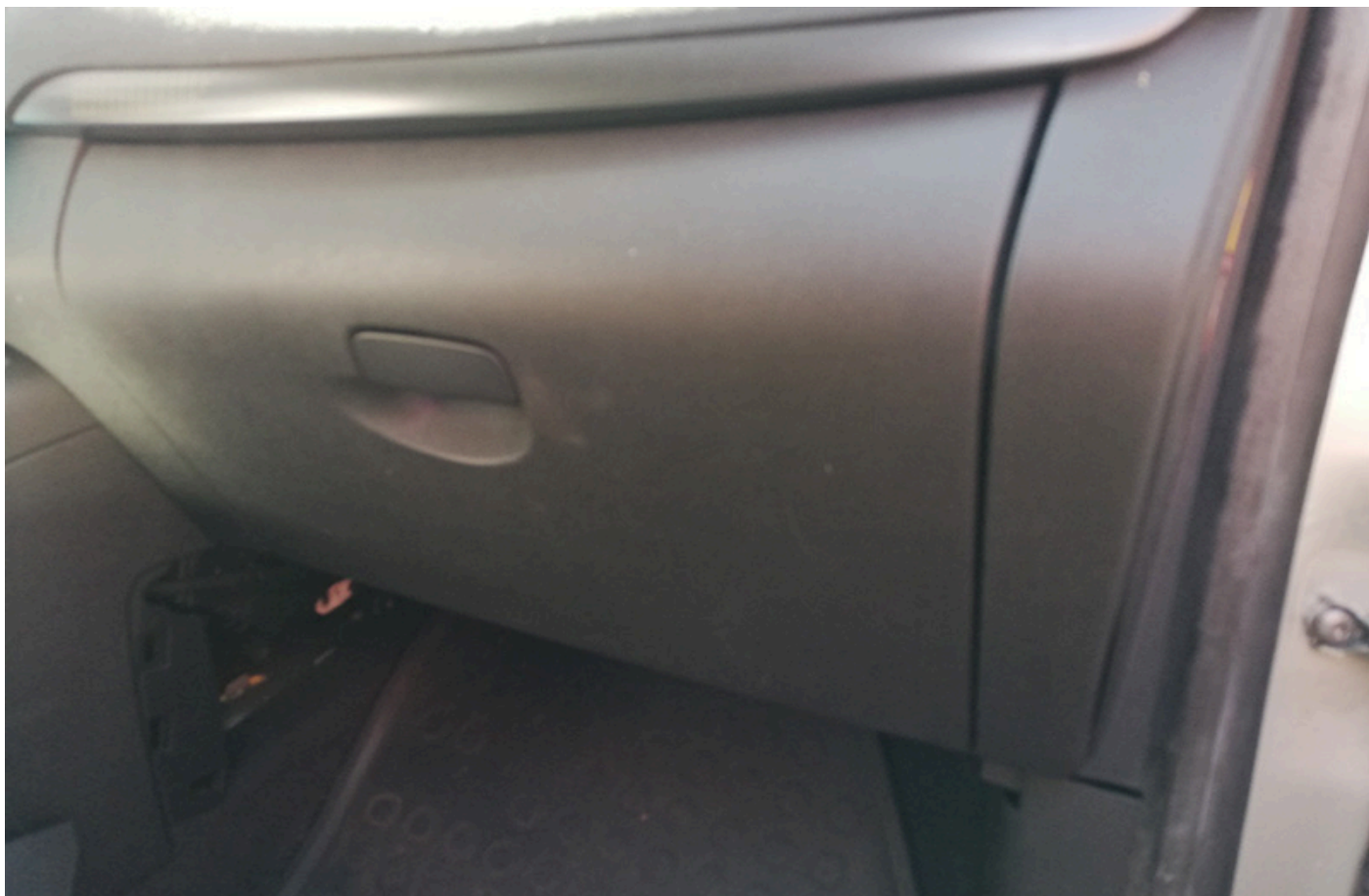
Boîtes à gants