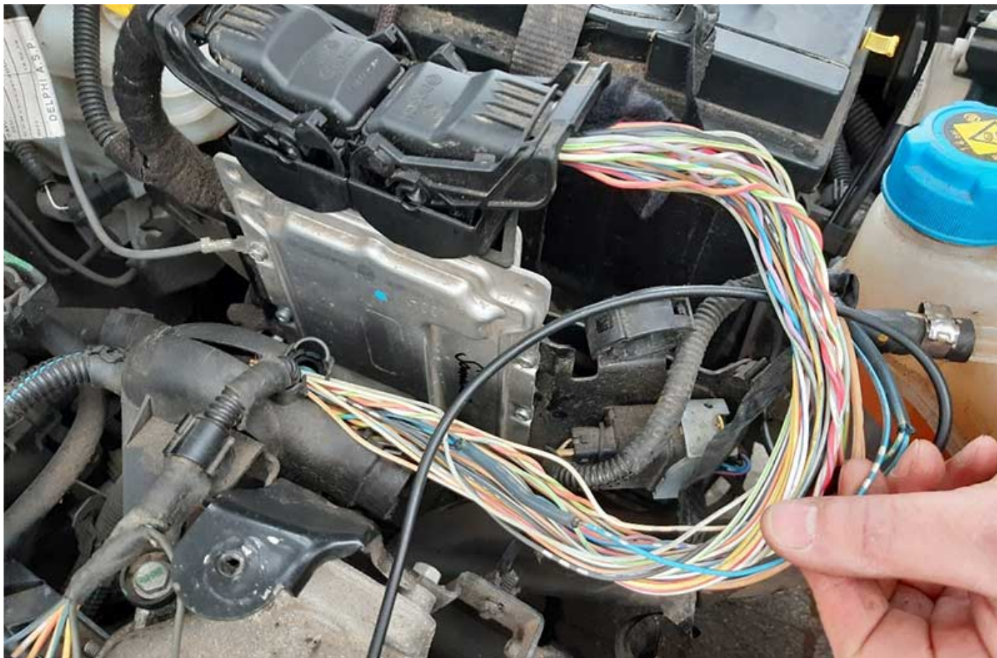
Figure 1 : Vérifier le faisceau de câbles qui va du calculateur moteur à la bobine d'allumage ou aux injecteurs

Différents codes d'erreur peuvent être enregistrés dans la mémoire des défauts, se rapportant à l'allumage ou aux injecteurs. Le défaut se produit souvent de manière sporadique.