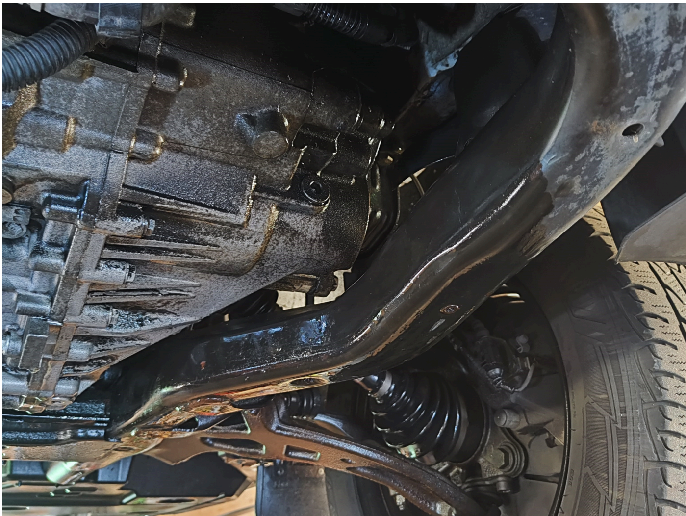
Pérdida de combustible T6

¡Observe siempre en este contexto las instrucciones de reparación del fabricante del vehículo!