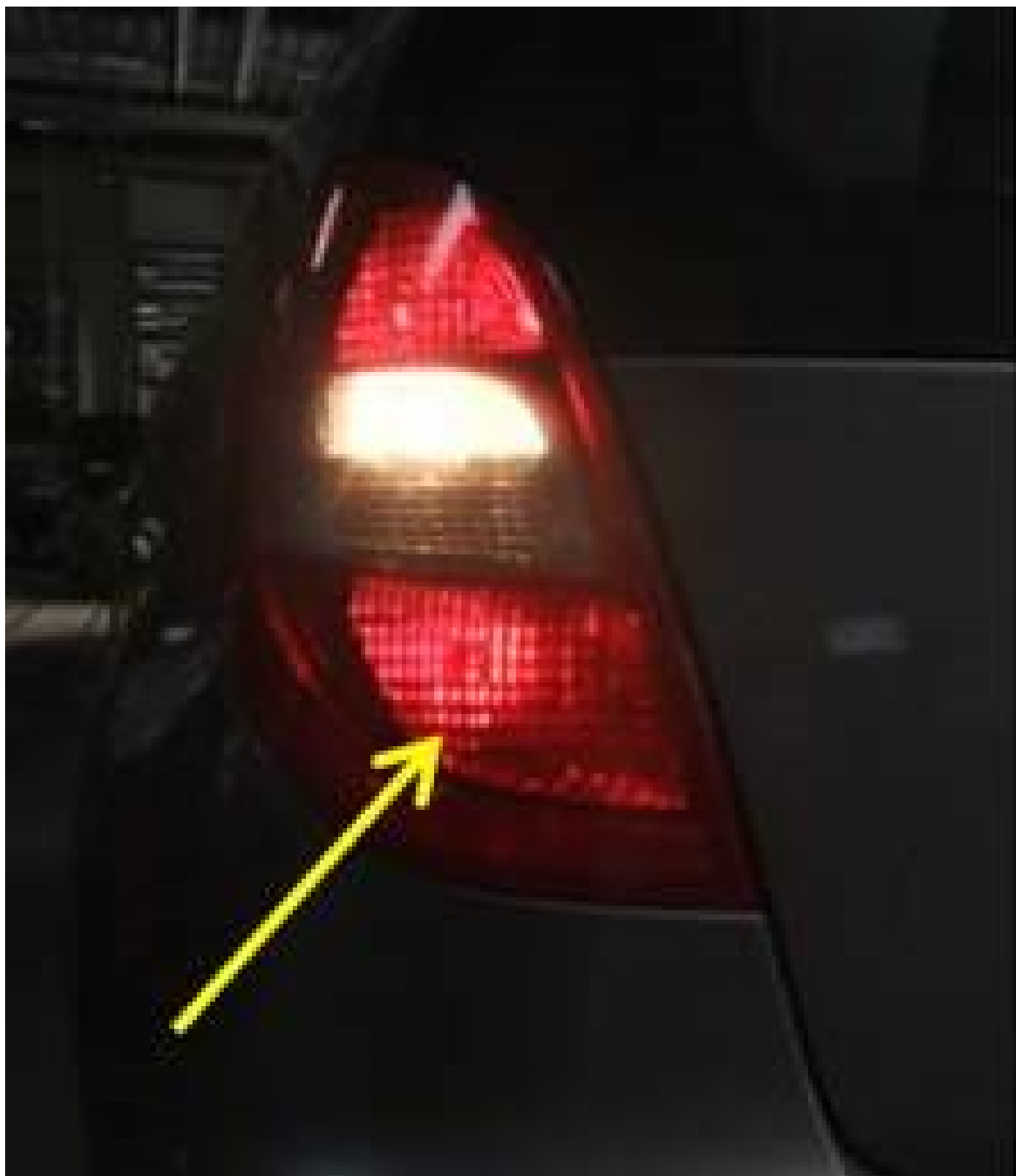
Imagen 1 Imagen 2