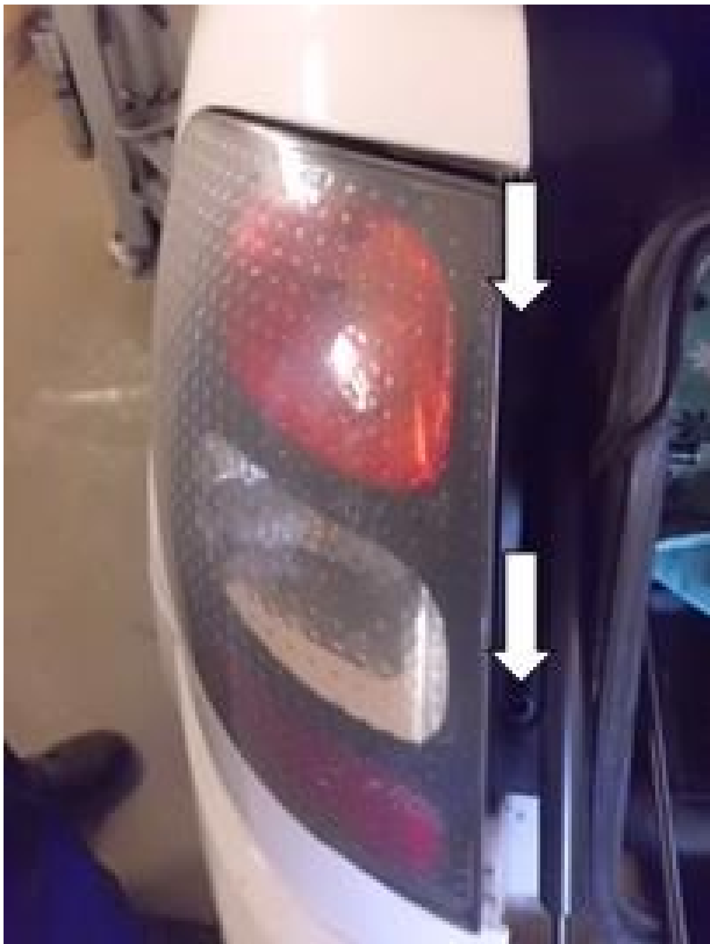
Figura 1 Figura 2