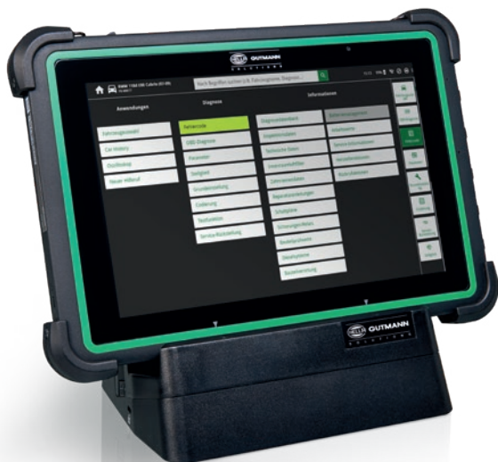
Tablette Hella Gutmann avec station de charge

Avec la tablette Hella Gutmann proposée en option, se lancer dans le diagnostic est d'une grande facilité. Cette tablette moderne sous Android est fournie avec sa station de charge, qui comporte de nombreuses connectiques (HDMI, Ethernet, etc.). Nous l'avons sélectionnée en prêtant une grande attention à la rapidité, à la fiabilité et à la robustesse, et adaptée en vue du diagnostic avec le mega macs X.