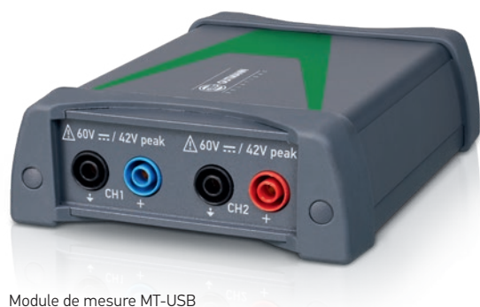
Module de mesure MT-USB