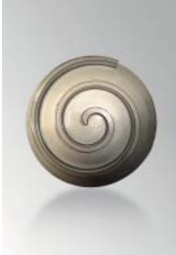
Compresseur à spirale