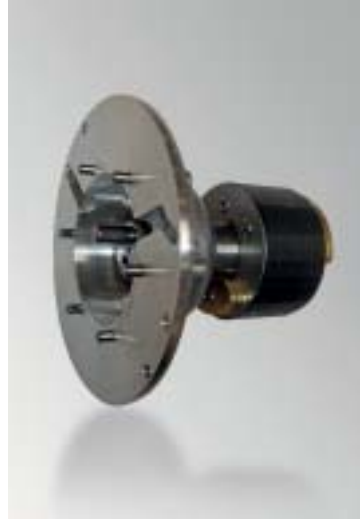
Moteur haut voltage