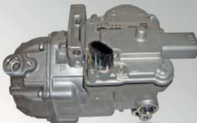
Compresseur haute tension