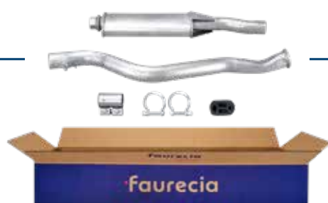
KIT DE SILENCIADOR