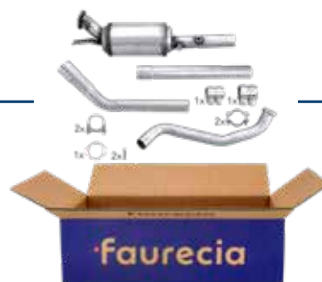
KIT DE FILTRO DE PARTÍCULAS DIÉSEL (DPF)*

MÁS DE 3300 KITS PARA MÁS DE 26.000 REFERENCIAS DE APLICACIONES OE