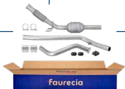
KIT DE CATALIZADOR

MÁS DE 3300 KITS PARA MÁS DE 26.000 REFERENCIAS DE APLICACIONES OE