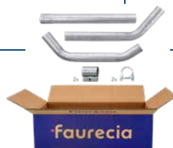
KIT DE TUBO DE ESCAPE