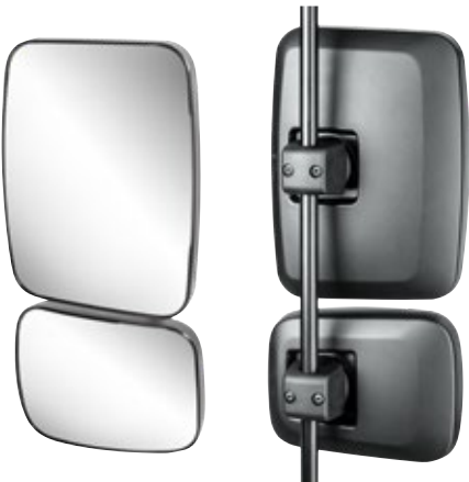
Kombinationsbeispiel 8SB 501 550-001 und 8SB 015 039-081