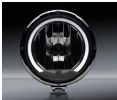
Vue de nuit