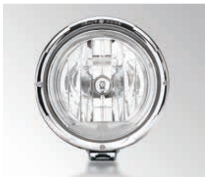
Vue de jour