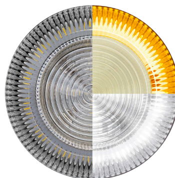
Lampe de travail, blanc