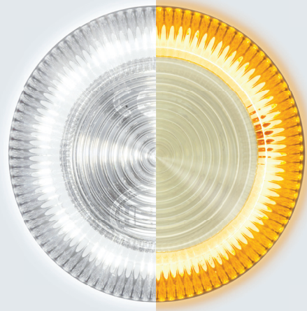
Lampada da lavoro bianca