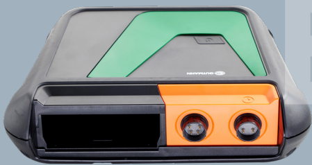
bestehend aus MT-HV