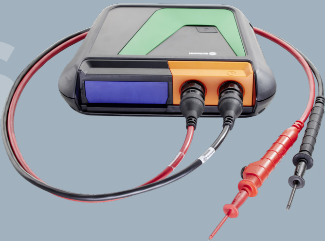
bestehend aus MT-HV + Hochvolt-Messleitungen schwarz/rot