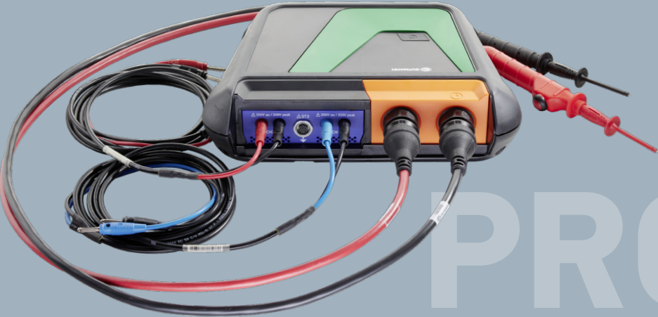
bestehend aus MT-HV + Hochvolt-Messleitungen schwarz/rot + MT-77 + Messkabel scharz/blau + Messkabel schwarz/rot