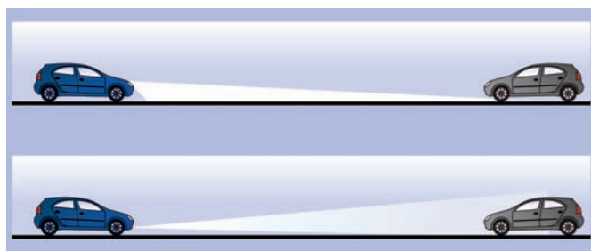
Abb.: Systemvergleich Abblendlicht gegenüber Tagfahrlicht

* im Vergleich zum Fahren mit Abblendlicht