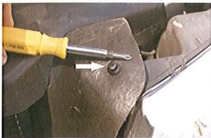
Le schéma 1