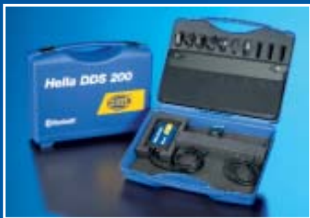
Hella DDS 200