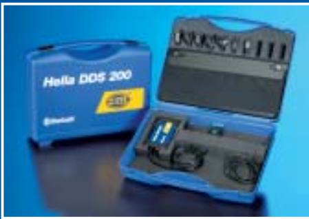
Hella DDS 200