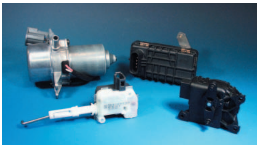
Produktportfolio EE-8 Aktuatoren

Bereits heute verfügt Hella über weltweite Entwicklungs- und Fertigungsstandorte für Aktuatoren und baut seine internationale Kompetenz, vor allem im NAFTA- und im asiatischen Raum, weiter aus.