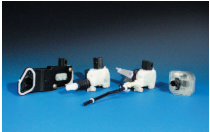
Aktuatoren für Schließsysteme

Seit 1996 produziert Hella derartige Aktuatoren auf vollautomatischen Fertigungsanlagen in Stückzahlen von z. Zt. über 9 Mio. Stück pro Jahr – auf 3 Kontinenten.