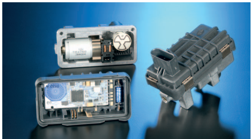
Motorraumsteller mit Regelelektronik

Seit Mitte 1999 fertigt Hella diesen Aktuator in Großserie.