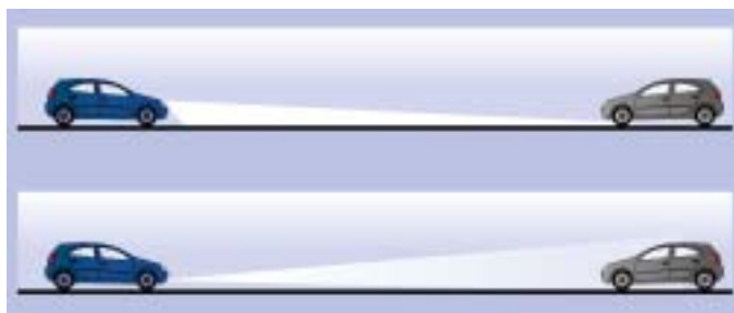
A tompított fényszóró és a nappali menetjelző összehasonlítása

*a tompított fényszóró használatával összehasonlítva