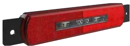
Modul mit Rückstrahler für Doppelmontage (links / rechts)