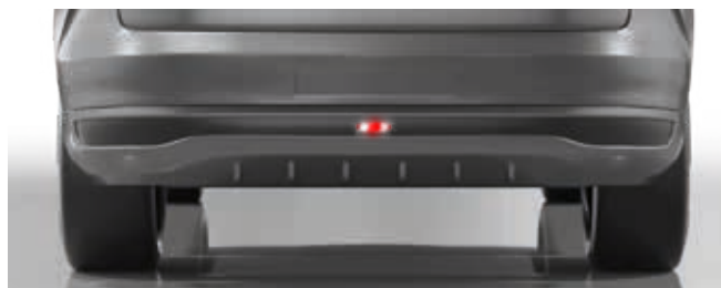
Mitte: RL, NL