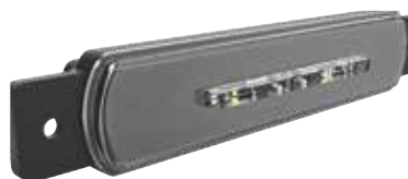
Modul ohne Rückstrahler für Einzelmontage (zentral)